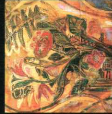
「南の花」 Southern flowers