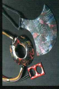
「七宝焼アクセサリー」 Cloisonne accessories