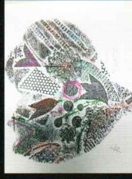
「野辺の花」 Field flowers