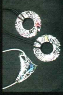
「ロウ七宝アクセサリー」 Wax cloisonne accessories