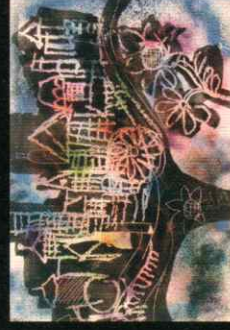
「花と町」 Flowers and town