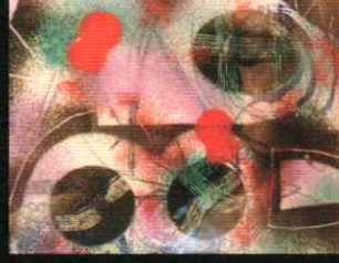
「糸の町」 Thread town